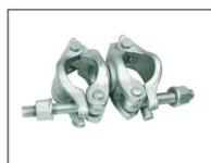
美式锁压旋转扣件American style Swivel Coupler