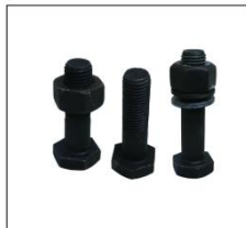
钢结构螺栓 STEEL STRUCTURAL BOLT