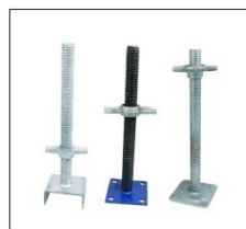
可调实心丝杠 ADJUSTABLE SOLID SCREW BASE JACK