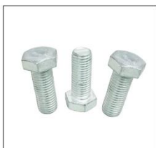
30栓、21栓 30 BOLTS, 21 BOLTS