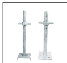
可调空心丝杠 ADJUSTABLE HOLLOW SCREW BASE JACK