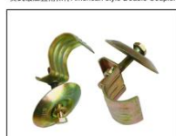
冲压蘑菇扣件Pressed Limpet Coupler