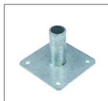
镀锌小底座 BASE PLATE