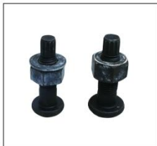
扭剪螺栓 TORSION BOLT

邯郸市瑞涛紧固件有限公司 电话/TEL: 0310-6767881 6767882 Handan City Ruitao Fastener Manufacturing CO.,LTD