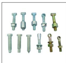
扣件螺栓螺母垫片 COUPLER BOLT & NUT&WASHER