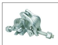
美式锁压直角扣件American style Double Coupler

邯郸市瑞涛紧固件有限公司 电话/TEL: 0310-6767881 6767882 Handan City Ruitao Fastener Manufacturing CO.,LTD