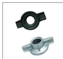
丝杠螺母 BASE JACK NUT

邯郸市瑞涛紧固件有限公司 电话/TEL: 0310-6767881 6767882 Handan City Ruitao Fastener Manufacturing CO.,LTD