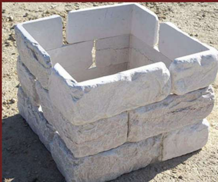
Angoli da rivestimento