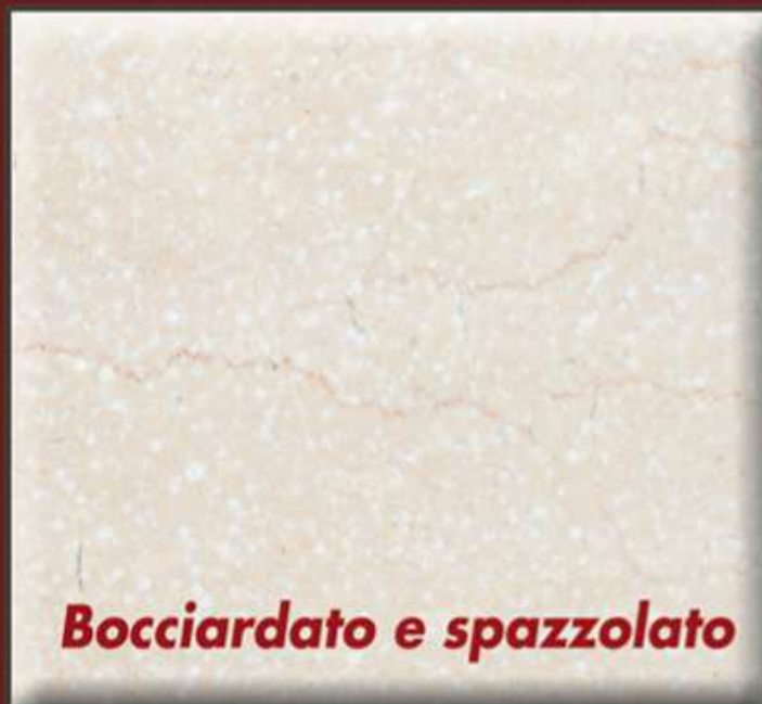
Bocciardato e spazzolato