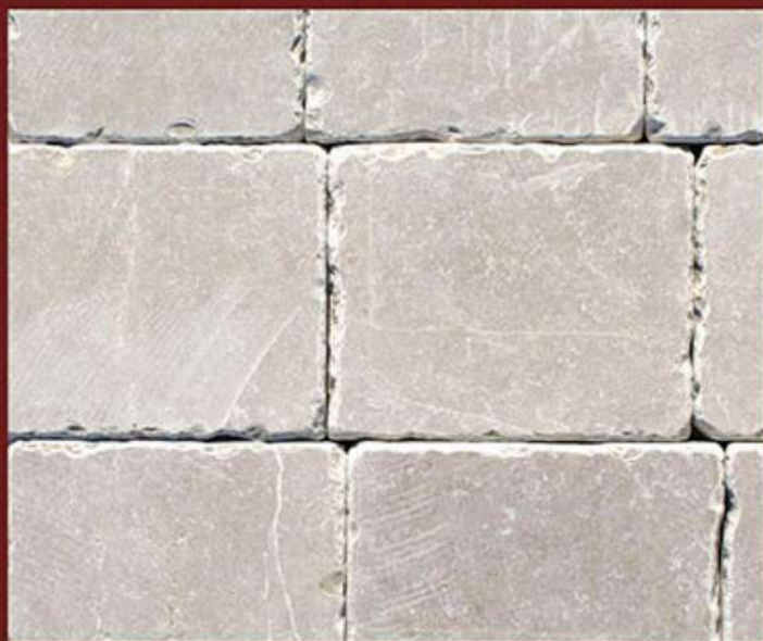
Piano sega burattata