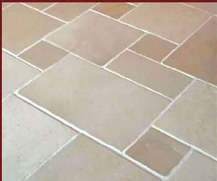
Opus Burattato e Spazzolato