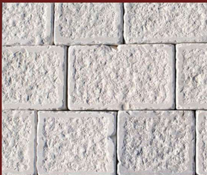
Spuntellata e burattata