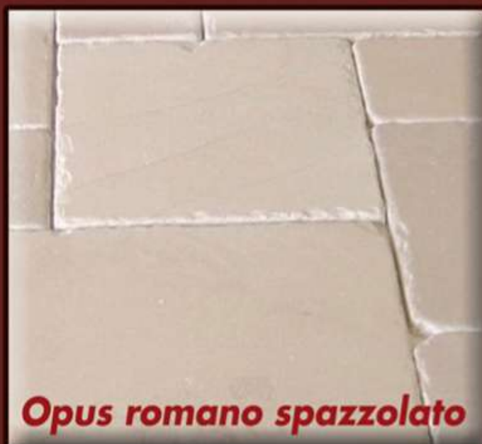
Opus romano spazzolato