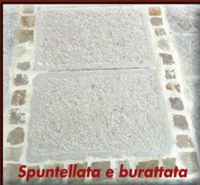
Spuntellata e burattata