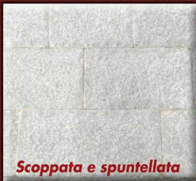
Scoppata e spuntellata