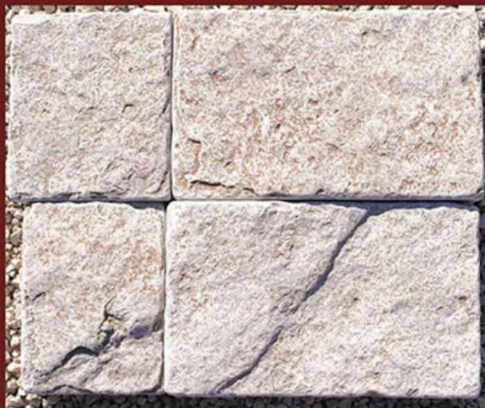
Piano cava squadrata e burattata