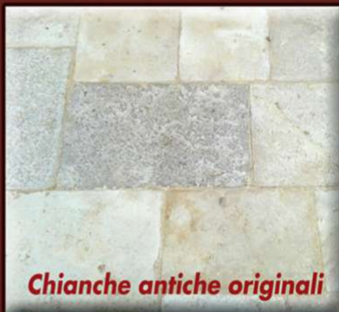
Chianche antiche originali