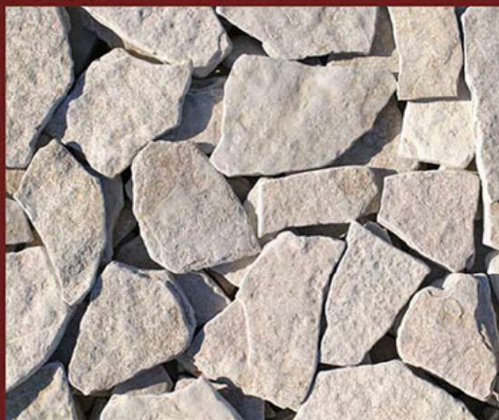
Scorza (opus incertum) burattata