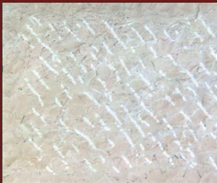
Scoppata e puntinata