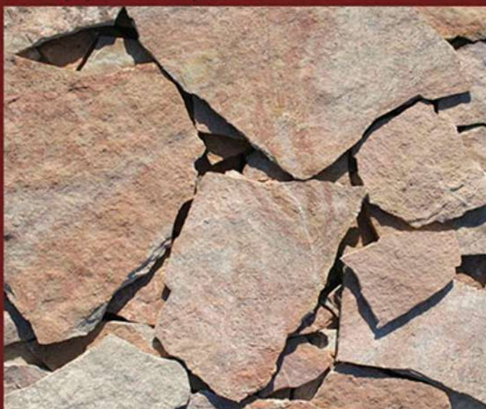
Scorza (opus incertum)