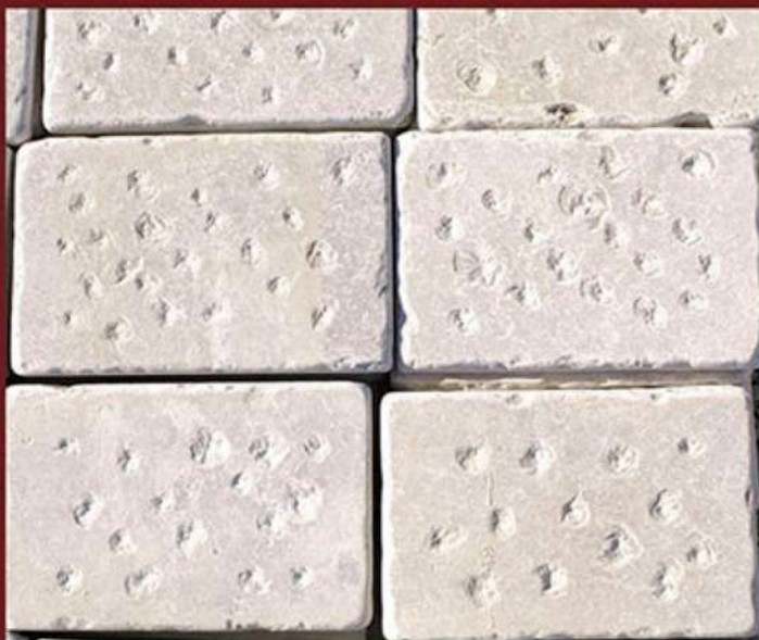
Puntellata e burattata