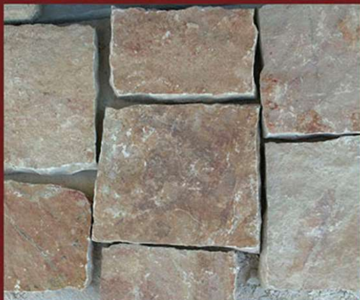
Piano cava tranciata