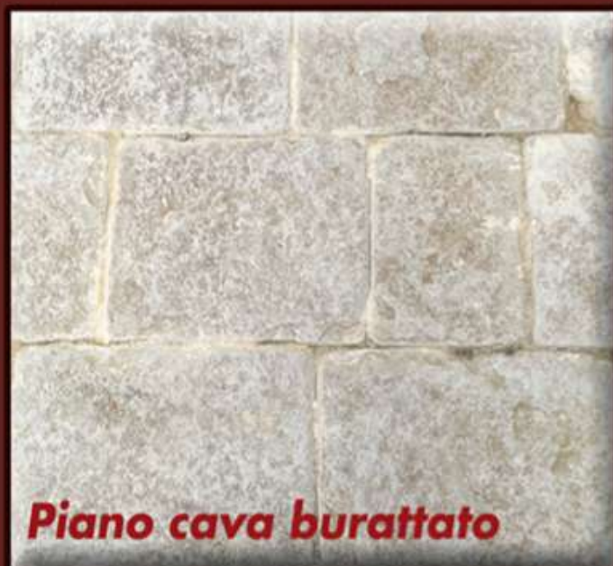
Piano cava burattato